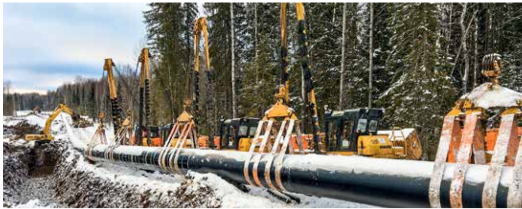
Укладка сваренного трубопровода «СМГ Ухта — Торжок. П нитка (Ямал)» (март 2018)

— Революционно новые технологии при строительстве объектов не применялись, но прогресс не стоит на месте. В частности, использовались новые виды изоляционных материалов и балластирующих устройств (УБО-УМ вместо УБО-1420 и т. д.). Кроме того, в связи с выходом в 2014 году «Временных требований к организации сварочно-монтажных работ, применяемым технологиям сварки, неразрушающему контролю качества сварных соединений и оснащенности подрядных организаций при строительстве, реконструкции и капитальном ремонте магистральных газопроводов ОАО «Газпром»» значительно выросли требова-