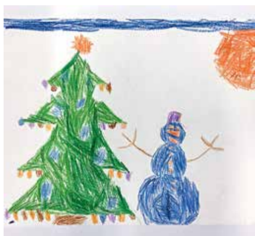
II МЕСТО (155 ГОЛОСОВ): «НОВОГОДНИЙ ЗАКАТ» ДЕНИС ДАНИЛЬЧЕНКОВ 5 ЛЕТ