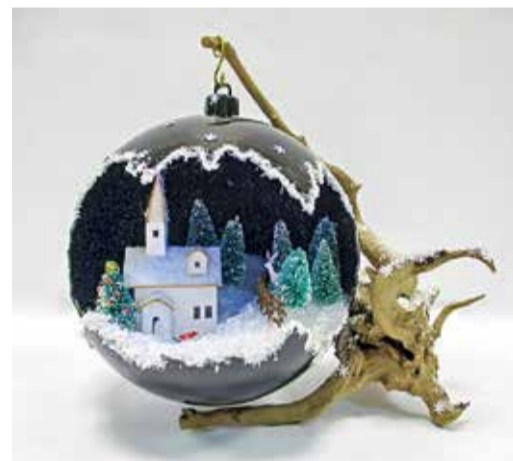
III МЕСТО (96 ГОЛОСОВ): «НОЧЬ ПЕРЕД РОЖДЕ- СТВОМ», ЮЛИЯ ХОМЕЦ, главный специа- лист Отдела обеспечения защиты имущества Управления корпоративной защиты

помощью простого плетения. Было много вариантов, как украсить елку. Сначала — различными веселыми смайликами, потом — нарисованными пяточками! Я зарисовывала эти идеи, выглядело очень забавно. Думаю, одну из них я где-то еще использую.