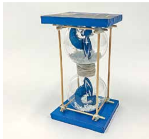
III МЕСТО (135 ГОЛОСОВ): «КАК НИ КРУТИ — ГАЗПРОМ!» НИКИТА НИКУЛИН 10 ЛЕТ