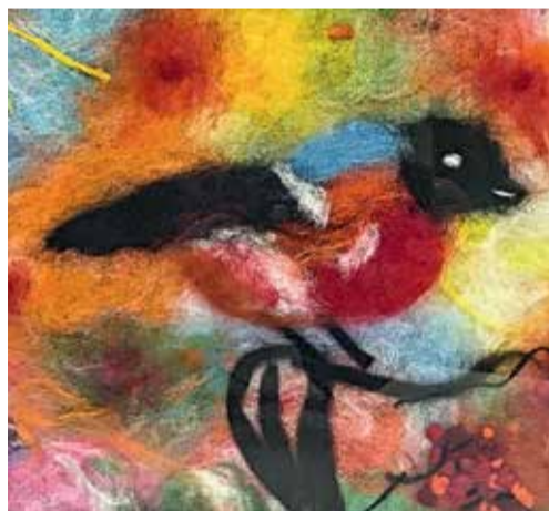
III МЕСТО (176 ГОЛОСОВ): «МОЙ СНЕГИРЁЧЕК» АНАСТАСИЯ ГОРБУНОВА 7 ЛЕТ