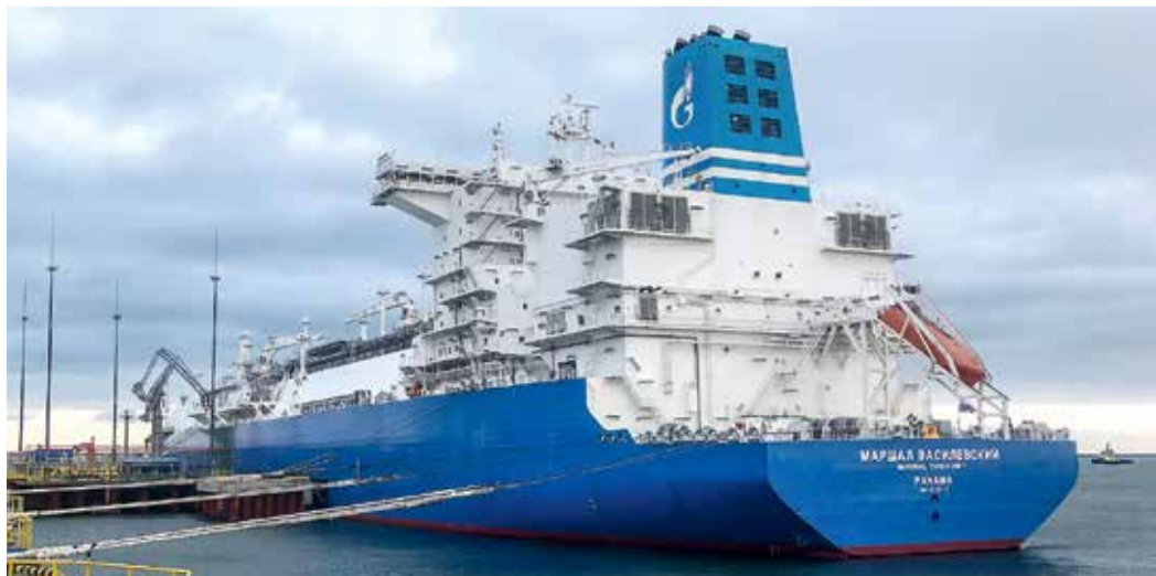
Плавающая регазификационная установка «Маршал Василевский» встала на рейд Балтийска в середине декабря. ПРГУ будет использоваться для поставок газа в Калининградскую область и его закачки в подземное хранилище.

ности компрессорной станции. На данный момент четыре подземных резервуара уже находятся в эксплуатации: первые два из них были опытными, на 230 тысяч кубометров, два других — уже на 400 тысяч кубометров. В дальнейшем мы увеличим объем первых двух резервуаров до 400 тысяч кубометров и построим 14 подземных резервуаров в общей сложности на 800 миллионов кубометров газа. Это позволит справляться с перебоями в поставках и с падением давления в зимний период. В зависимости от времени года этих запасов хватит Калининградской области примерно на 2–4 месяца.