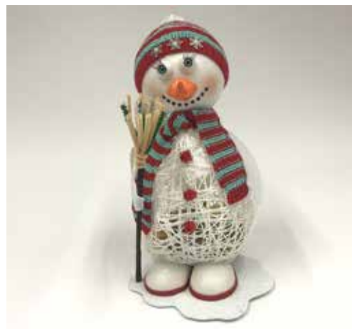
I МЕСТО (165 ГОЛОСОВ): «СНЕГОВИК-КОНФЕТНИЦА» СВЯТОСЛАВ ПАШКОВ 10 ЛЕТ