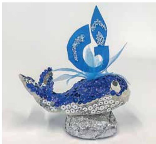
III МЕСТО (152 ГОЛОСА): «МОРСКОЕ ЧУДО» ОЛЬГА ФОРМИХИНА 5 ЛЕТ