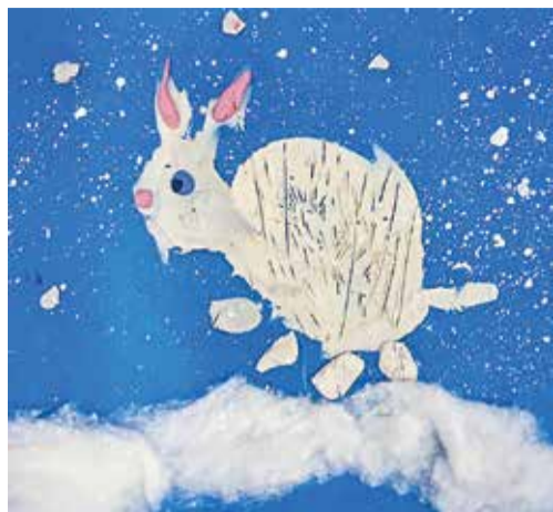
I МЕСТО (205 ГОЛОСОВ): «РОЖДЕСТВЕНСКИЙ ЗАЯ» ВЛАДИМИР КОСЕНКОВ 5 ЛЕТ