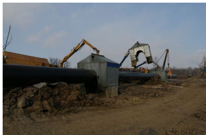
Магистральный газопровод «Сахалин–Хабаровск–Владивосток». Установка сварочных комплексов

Все работы на объектах строительства выполняются в строгом соответствии с требованиями к соблюдению техники безопасности и охраны труда.