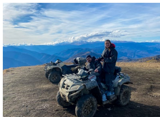
Заезд на квадроциклах на хребте Ду-Ду-Гуш (Адыгея)

«У НАС В ПОСЕЛКЕ, ГДЕ Я РОС, ПОЖАЛУЙ, ЦЕНТРАЛЬНОЕ МЕСТО – ЭТО КС «ЮБИЛЕЙНАЯ». ГАЗОВИКИ ВСЕГДА БЫЛИ В ПОЧЕТЕ, ПОЭТОМУ, КОГДА ВСТАЛ ВОПРОС О ВЫБОРЕ БУДУЩЕЙ ПРОФЕССИИ, Я НЕ ДОЛГО ДУМАЛ. ВЕДЬ РАБОТА, СВЯЗАННАЯ С ГАЗОМ – ЭТО СТАБИЛЬНОСТЬ И УВЕРЕННОСТЬ В ЗАВТРАШНЕМ ДНЕ».