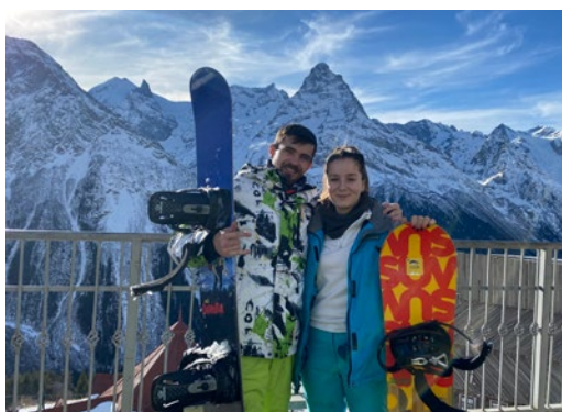
Поездка на Домбай

«МОГУ СЫГРАТЬ НОКТЮРН НА ФЛЕЙТЕ ВОДОСТОЧНЫХ ТРУБ, НО МНЕ МИЛЕЕ НЕ ВОДОСТОЧНЫЕ, А ТРУБЫ МАГИСТРАЛЬНЫХ ГАЗОПРОВОДОВ».