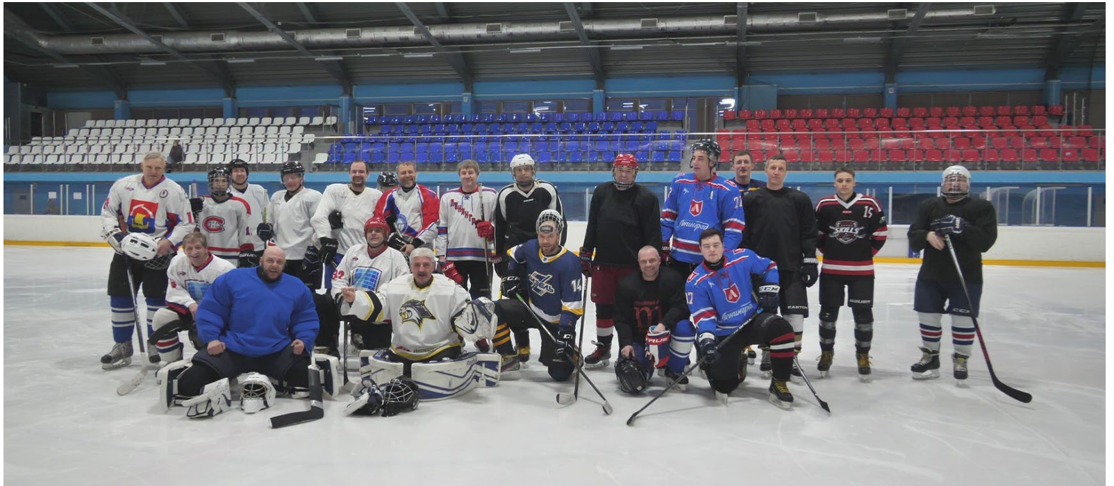
ХК «Ленинград» с друзьями